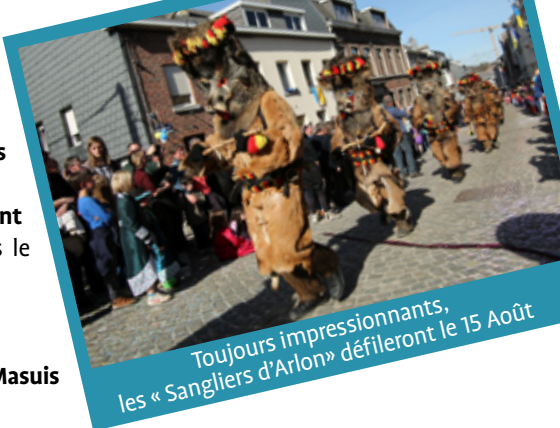
Toujours impressionnants, les « Sangliers d'Arlon » défilent le 15 Août