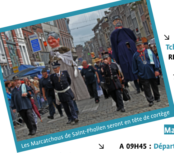
Les Marcatchous de Saint-Pholien seront en tête de cortège

↘ A 20H00 : Sur le podium du Monument Tchantchès (Pont Saint-Nicolas) : l'Orchestre REMEMBER