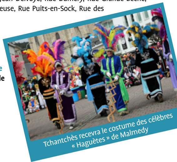
Tchantchès recevra le costume des célèbres « Haguètes » de Malmedy