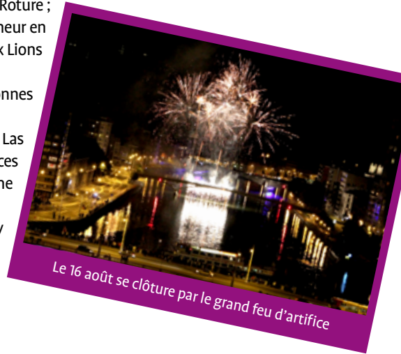
Le 16 août se clôture par le grand feu d'artifice